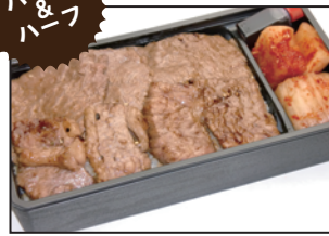
注文番号 04 仙台牛カルビ・ロース弁当 1,800円 (税込1,944円) カルビとロースの二種盛合せ