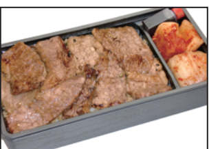
注文番号 05 上ハラミ弁当 2,800円 (税込3,024円) 肉汁がジュシーで旨さが違います