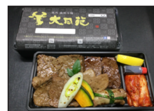
注文番号 08 大同苑特製弁当 3,250円 (税込3,510円) ネギタン塩・上タン塩・上ハラミ・仙台牛プリスケ 仙台牛ロース5種類のお肉のスペシャル