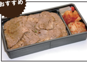
注文番号 01 仙台牛焼肉弁当 1,200円 (税込1,296円)