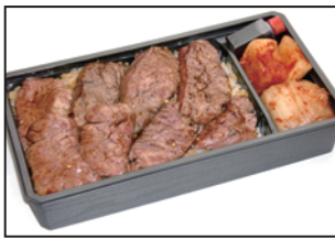
注文番号 03 仙台牛ロース弁当 1,700円 (税込1,836円) 柔らかい赤身肉です