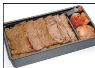
注文番号 07 仙台牛特選カルビ弁当 3,600円 (税込3,888円) とろける旨味は絶品です