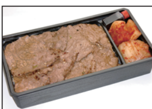
注文番号 06 仙台牛上カルビ弁当 2,800円 (税込3,024円) 霜降り肉!!格別の旨さです